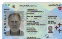
Permesso di dimora Copia fronte e retro

Si prega di inviare la copia del documento d'identità unitamente alla richiesta al seguente indirizzo: Cornèr Banca SA Succursale BonusCard (Zurigo) Casella postale 8021 Zurigo