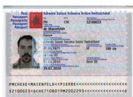
Passaporto Copia della pagina con la foto e la firma