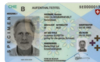
Autorisation de séjour Copie recto verso

Veillez envoyer la copie d'une pièce d'identité avec la demande à: Cornèr Banque SA Succursale BonusCard (Zurich) Case postale 8021 Zurich