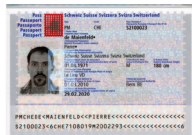
Passeport Copie de la page avec votre photo et votre signature