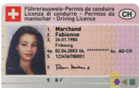
Permis de conduire Copie recto